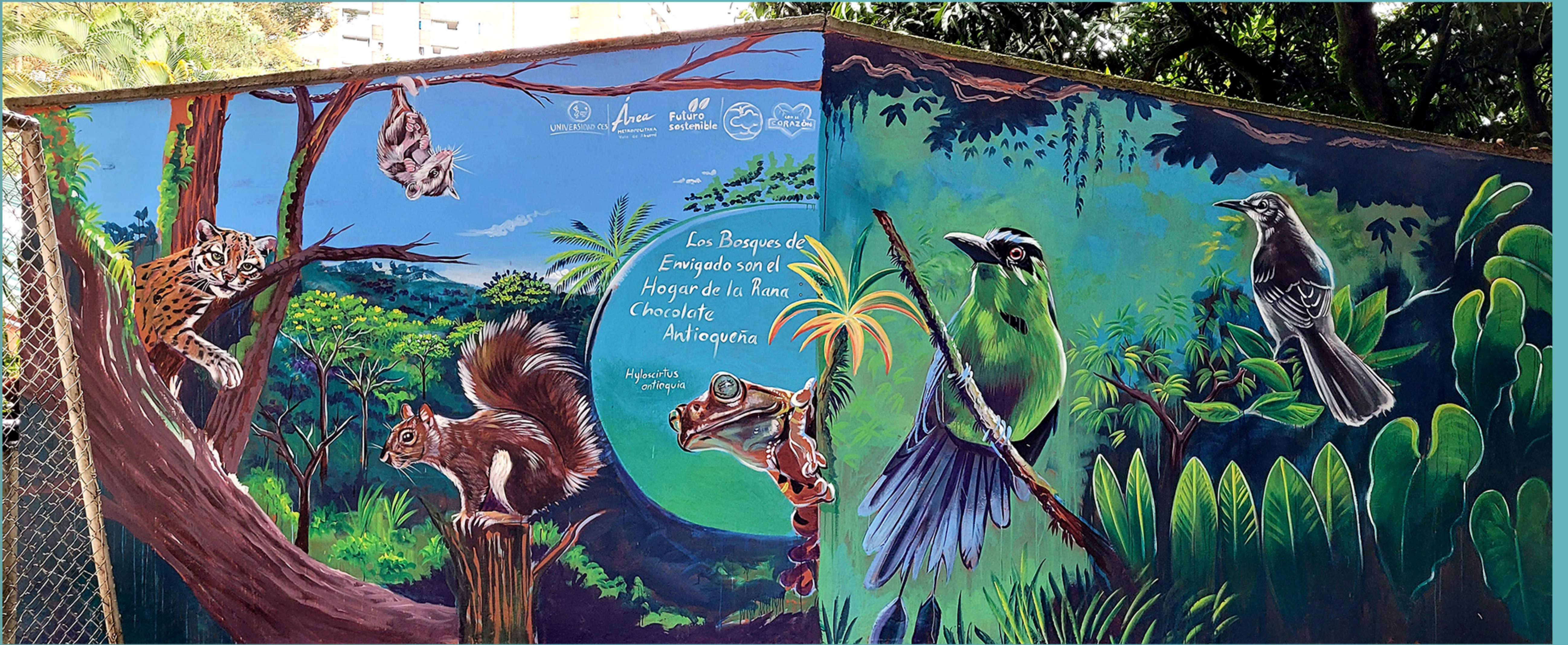
Mural en Institución Educativa Barrio El Trianón, Envigado.