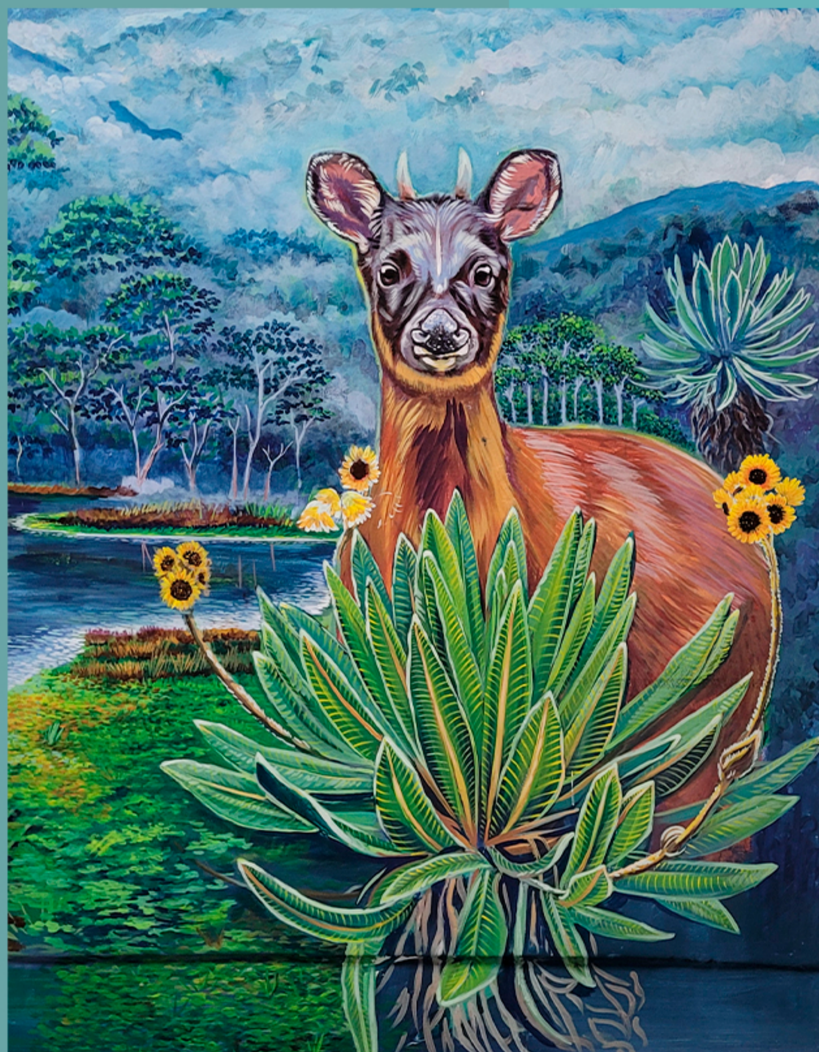
Mural en Instalaciones Sede Central Corantioquia (Detalle).