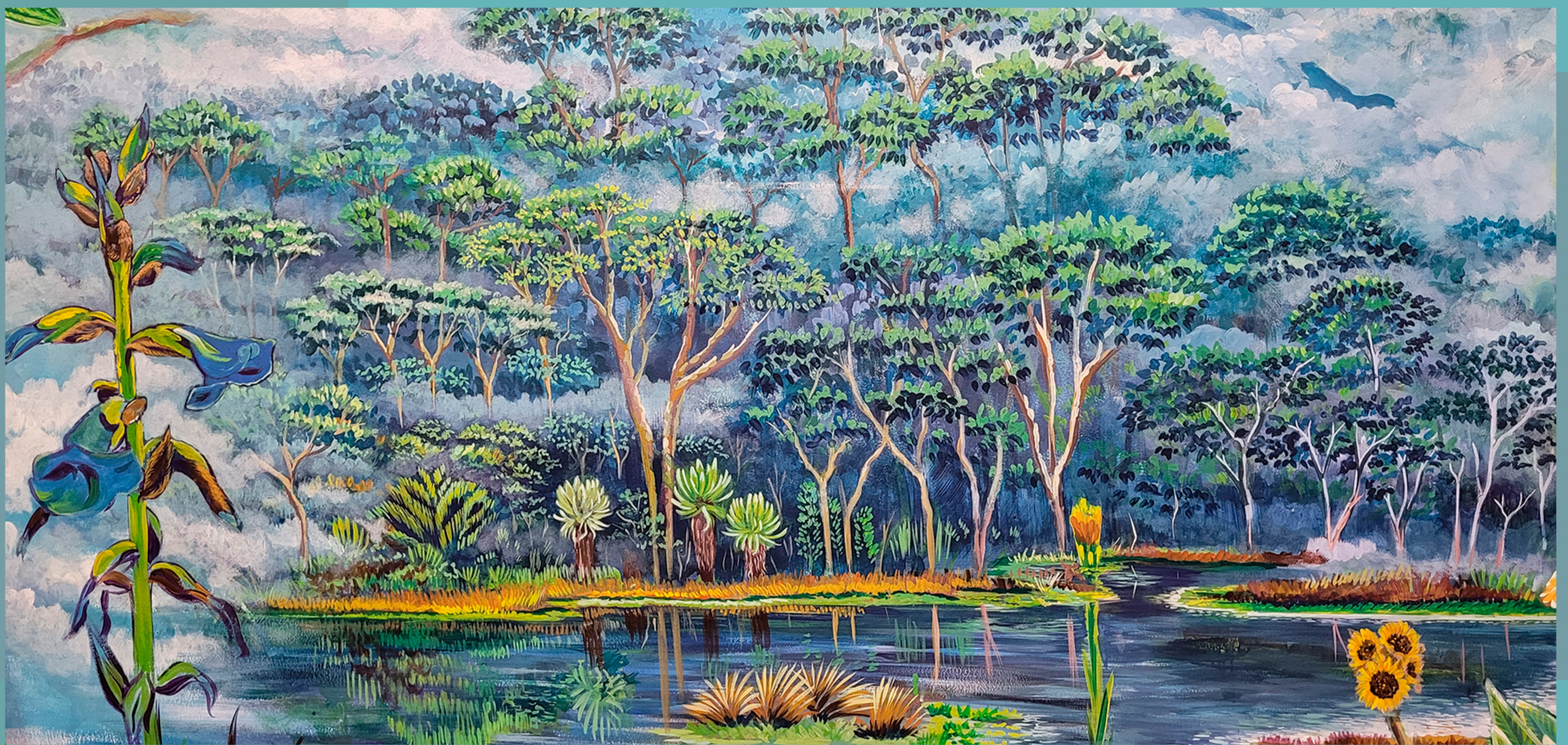
Mural en Instalaciones Sede Central Corantioquia (Detalle).