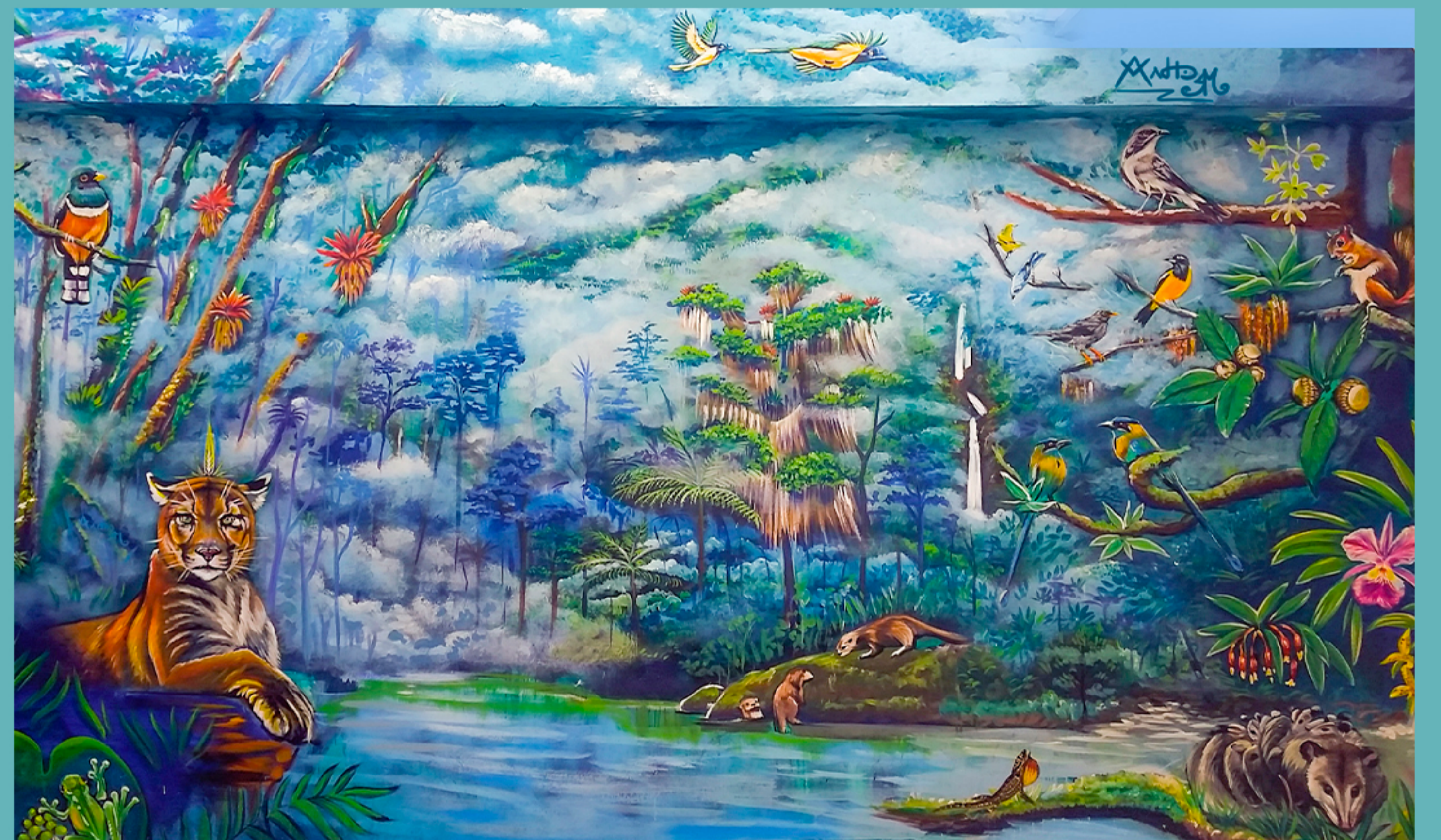
Mural Instalaciones Administración Municipal San Andrés de Cuerquia